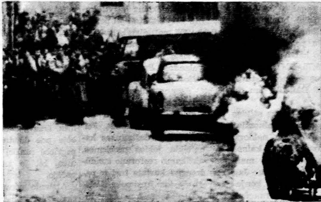
Kareiviai ir civiliai stebi degantį automobilį Alžiro vidurmiestyje. Automobilį padegė slaptosios kariuomenės organizacijos vyrai. Prancūzų saugumiečiai areštavo 21 įtartinį slaptosios kariuomenės organizacijos narį.

Bylos parodo dar vieną dalyką: spaudimas daromas net tiek spekuliantams, kiek katalikams bei žydams. "New York Times" seneniai rašė, kad spekuliacija vyko visoje Sovietų Sąjungoje su pilna policijos žinia. Užnagaryje, be abejo, yra daug stambesnių žuvų. Jų niekas nedrįsta judinti, bet dėmesį reikia kur nors nukreipti nuo jų. Čia ir praverčia Lietuvos kunigai bei žydai. N.