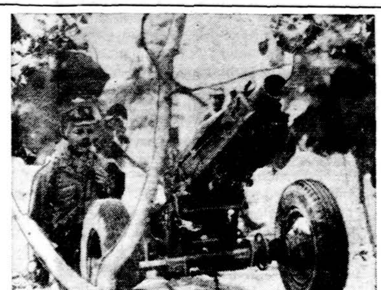
Laoso karys stovi prie 75 mm. pabūklų, kovoj su raudonaisiais dėl Nam Tha miesto.